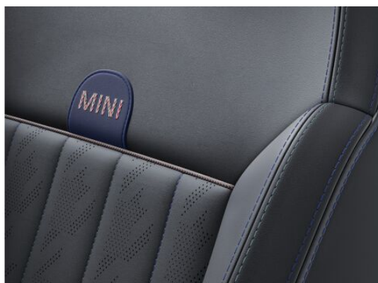
Veštačka koža "Vescin" | Nightshade Blue KXJ2