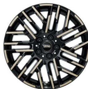
Alu. felne 18" Night Flash Spoke 2 nijanse 1QL